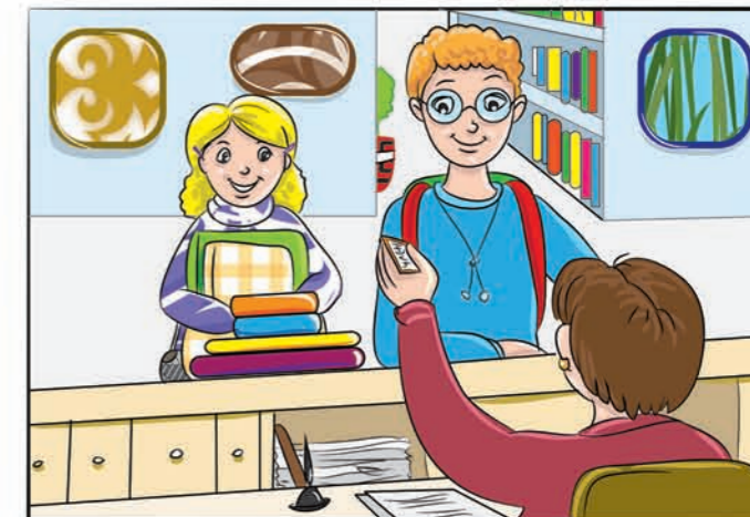
Лични податоци се даваат и при добивање членски карти во библиотеки, разни спортски клубови; потоа се даваат и податоци за учество во наградни игри или патувања...