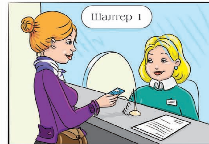
Кога се во банка, вашите родители мора да го кажат бројот на нивната банкарска сметка, на која се заведени нивните лични податоци.