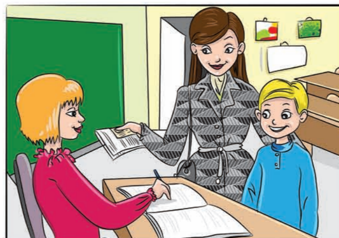
Во училиште, наставникот мора да има лични податоци како за тебе така и за твоите родители...

Секојдневно секој од нас, особено возрасните даваат лични податоци на разни организации, фирми или поединци. Тоа го прават за да можат да остварат одредени права.