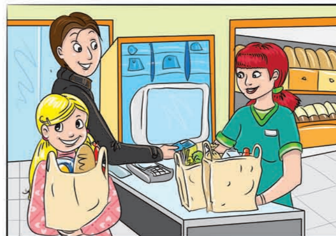
Исто така, тие го даваат бројот на кредитната картичка кога купуваат во продавница и плаќаат на каса...